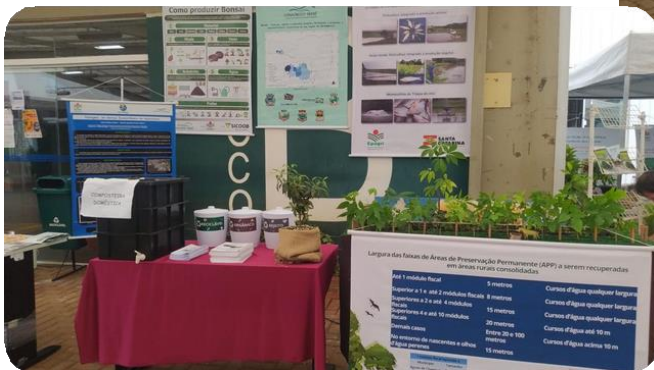
Registro fotográfico do evento