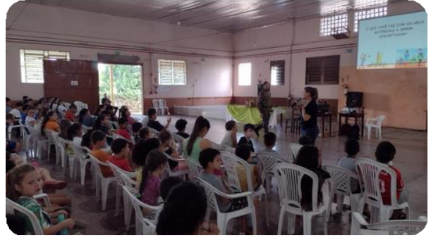
Registros fotográficos do evento realizado em Planalto Alegre