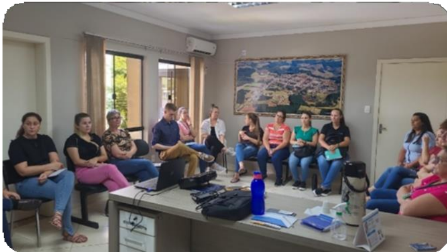
Registro fotográfico da reunião

Na tarde de 16 de fevereiro aconteceu no gabinete do Prefeito municipal de Planalto Alegre, reunião técnica para planejamento do primeiro 1º Encontro: Cidades que sensibilizam, motivam e transformam, atividades do Comitê Cidades Educadoras, com o objetivo de apresentar ações que somem para o bem estar deste município. Estiveram presente lideranças municipais e parceiros.