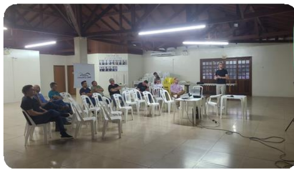
Registros fotográficos da Assembleia