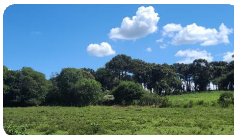
Registros Fotográficos do projeto mata ciliar