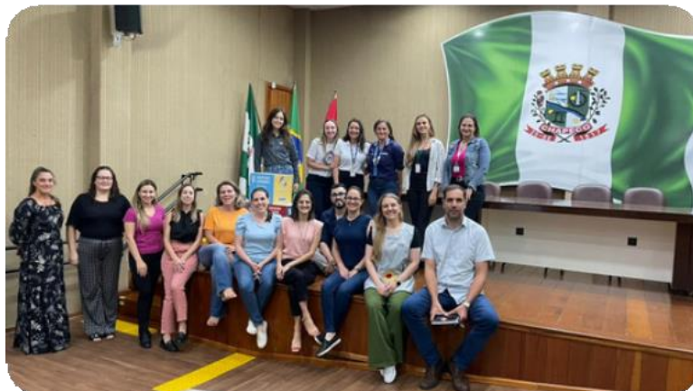
Registro fotográfico do evento