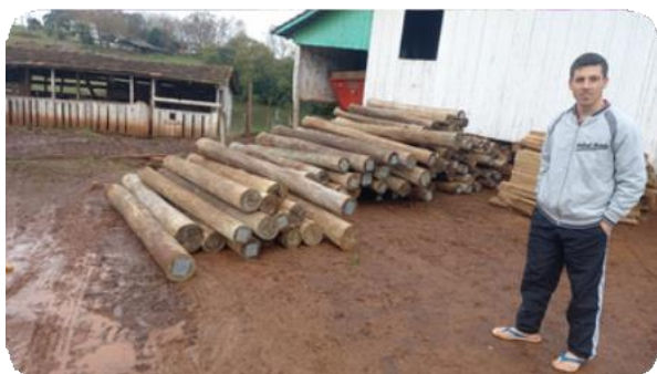
Registro fotográfico da entrega dos materiais