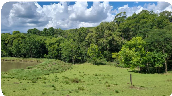
Registro fotográfico das visitas a campo

Nos meses de outubro, novembro e dezembro foram realizadas visitas técnicas nas propriedades rurais no entorno do Lajeado São José, em localidades que constam no relatório do Ministério Público, para levantar a quantidade de materiais necessários para a proteção das nascentes e cursos d'água, além de levar orientações para a legalização dos viveiros de piscicultura. Após a finalização das visitas técnicas, os técnicos elaboraram no escritório os relatórios ambientais das propriedades. Esse trabalho é uma parceria do Consórcio Iberê com a Epagri (Empresa de Pesquisa Agropecuária e Extensão Rural de Santa Catarina), a SEDER (Secretaria de Desenvolvimento Rural de Chapecó) e a Secretária de Agricultura de Cordilheira Alta.