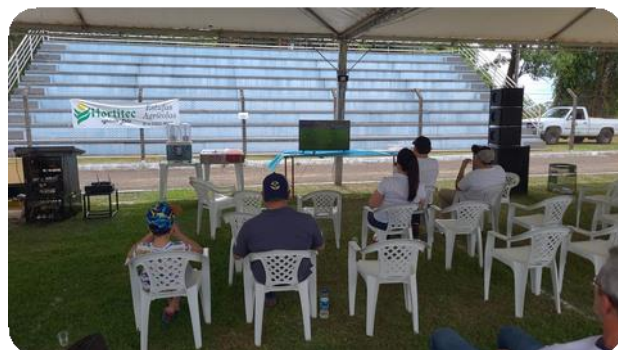
Registros Fotográficos da atividade