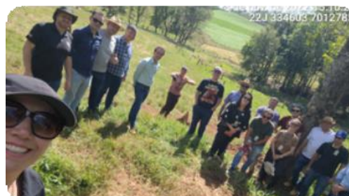
Registros Fotográficos da reunião