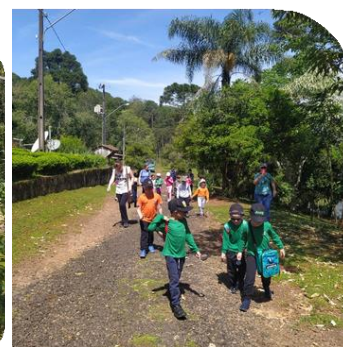
Registros Fotográficos da visita à FLONA