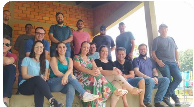
Registro fotográfico da reunião

Nos dias 17 de novembro e 16 de dezembro foram realizadas as reuniões dos grupos de trabalho do Consórcio Iberê. Na oportunidade, foram discutidos os projetos de Recuperação e Conservação de Matas Ciliares e o Plano Intermunicipal de Gestão Integrada de Resíduos Sólidos.