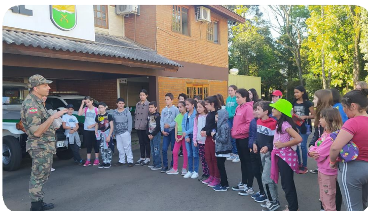
Registro da visita no 2º Batalhão da Polícia Militar Ambiental