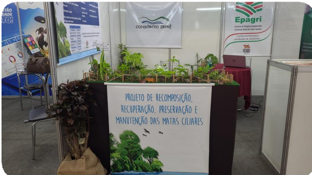
Registro Fotográfico do estande

Nos dias 29 e 30 de novembro de 2022 o Consórcio Iberê participou junto com a Epagri da 2ª Tec Agro, que aconteceu no Parque de Exposições Tancredo Neves – Efapi, no município de Chapecó, e apresentou transformação de ponta a ponta da cadeia agro e como isso irá impactar em todos os setores da economia.