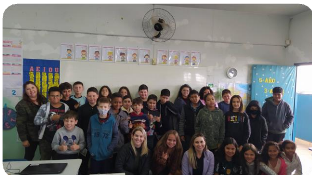
Registros Fotográficos da atividade

O Consórcio Iberê e a TOS Ambiental realizaram no dia 14 de outubro uma palestra de educação ambiental sobre resíduos sólidos aos alunos do 5º ano da Escola Básica Municipal Maria Bordignon Destri. Os alunos puderam conhecer como é o funcionamento de um aterro sanitário e como fazer a separação correta dos resíduos sólidos.