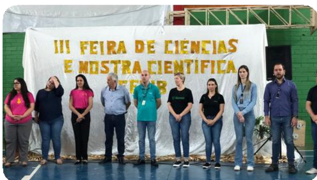
Registros fotográficos da feira