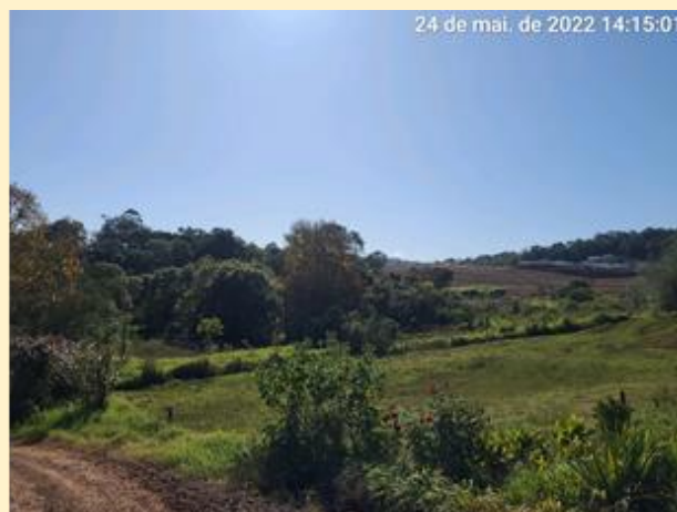
Registro fotográfico das visitas técnicas