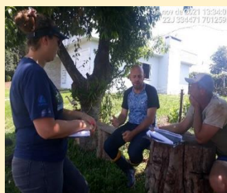
Registro fotográfico das atividades