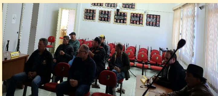
Registro fotográfico dos participantes da reunião