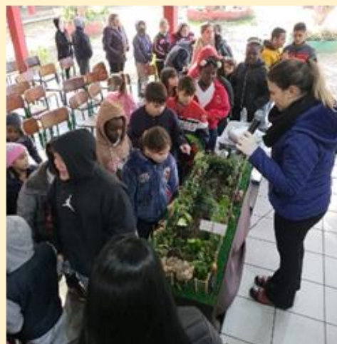
Registro fotográfico da atividade de Educação Ambiental