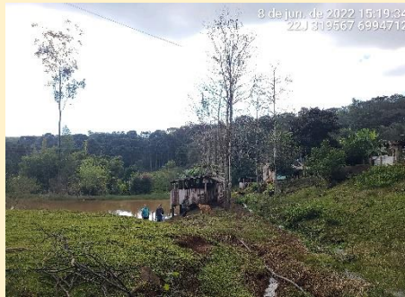
Registro fotográfico das visitas técnicas Foto: Consórcio Iberê, 2022