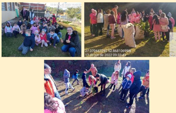
Registro fotográfico dos participantes da atividade de Educação Ambiental

Em comemoração ao mês do Meio Ambiente, no dia 13 de junho foi realizada atividade especial com as turmas da Escola Municipal Prof. a Cleusa Guindani Hunttmann. A ação foi promovida pelo Consórcio Iberê, em parceria com a Secretaria de Agricultura, Epagri e o Sicoob, responsável por fornecer as mudas de árvores frutíferas nativas. O objetivo da ação foi plantar mudas de diferentes tipos de árvores no entorno da escola, com participação de crianças do segundo e terceiro ano do período matutino e duas turmas do segundo ano do período vespertino.