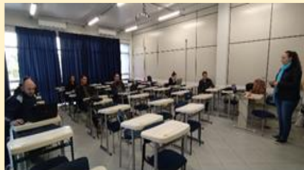
Registro fotográfico dos participantes do treinamento