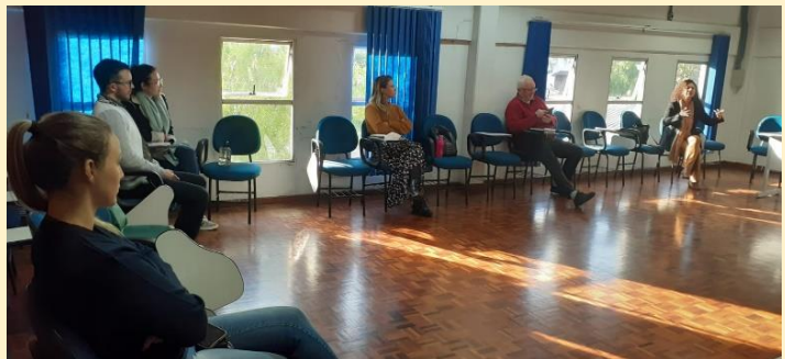
Registro fotográfico Da Reunião