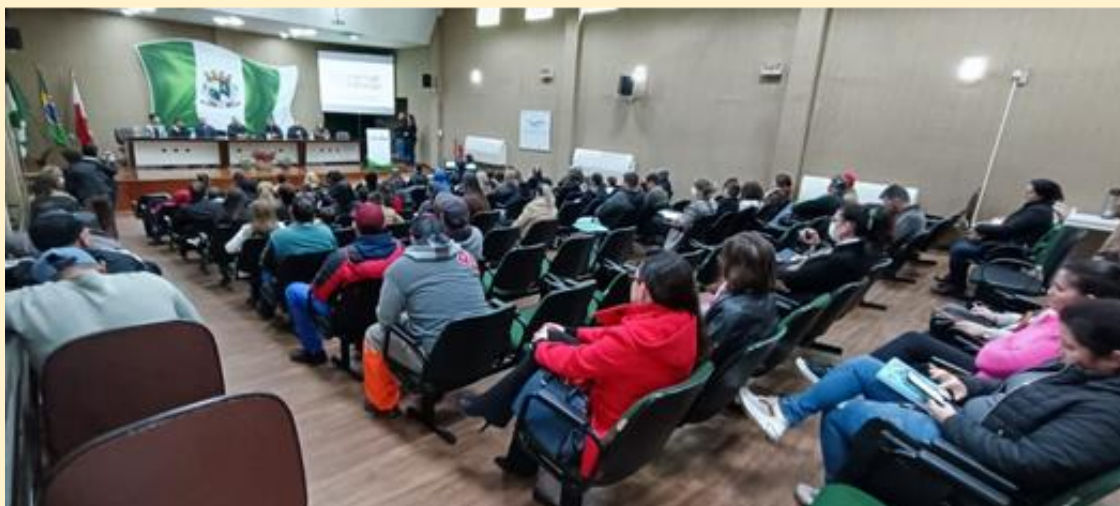
Registro fotográfico do lançamento da gincana