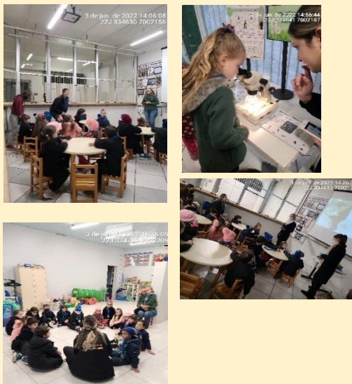
Registro fotográfico da atividade de Educação Ambiental

No dia 6 de junho o Consórcio Iberê, em parceria com o Museu de Ciências Naturais da Universidade Comunitária de Chapecó (UNOCHAPECÓ), e Colégio Exponencial, com os alunos da Educação Infantil 5C, realizaram visita de educação ambiental em comemoração ao Dia Mundial do Meio Ambiente (5). Os alunos vivenciaram oficina dos ovos, trilha especial e também participaram de atividades na brinquedoteca.