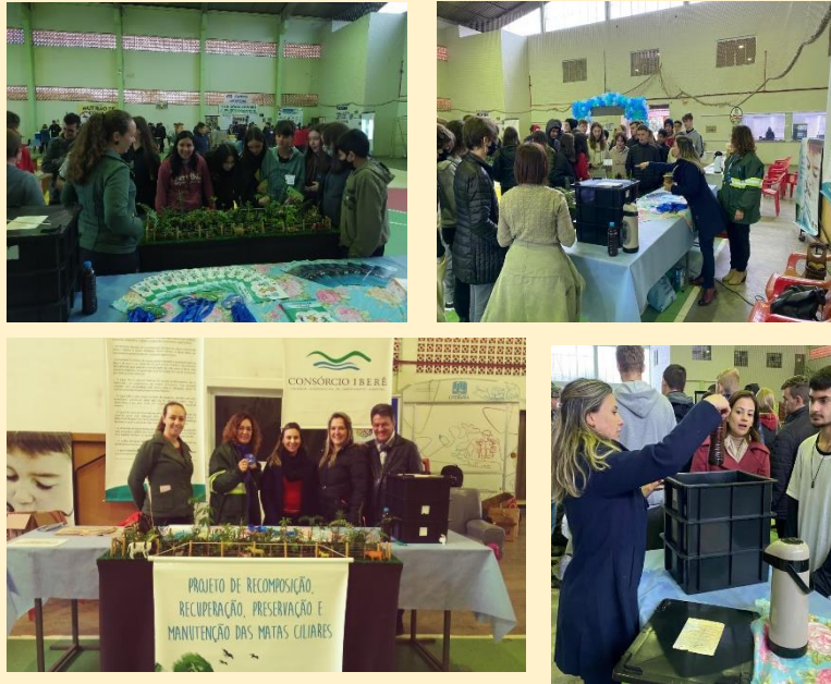
Registro fotográfico dos participantes

Participaram do evento as escolas municipais e estaduais, somando aproximadamente 500 visitantes, na oportunidade os alunos puderam visitar os espaços e aprender sobre diversos temas relacionados a sustentabilidade e preservação do Meio Ambiente.