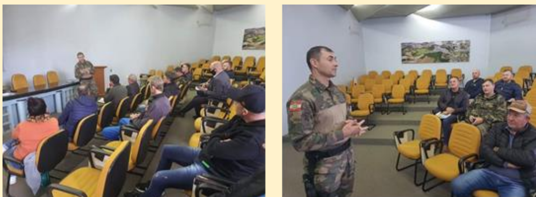
Registro fotográfico da reunião