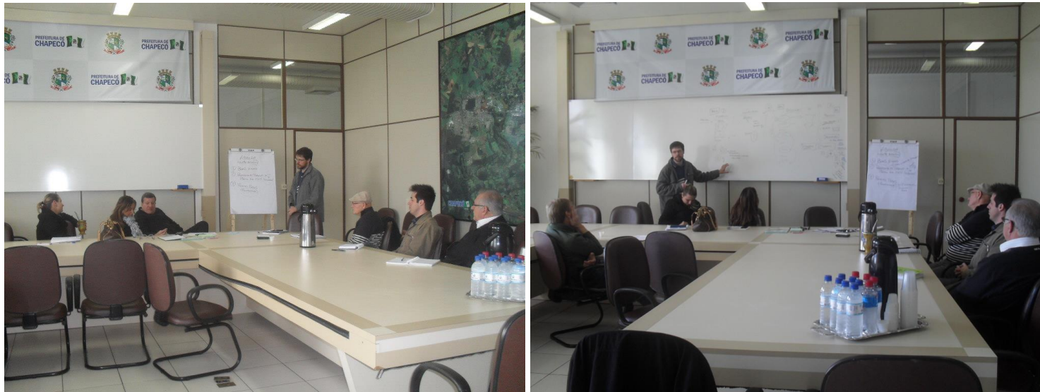
Figuras 3 e 4: Reunião do grupo diretor