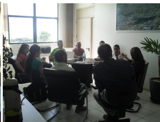
Figuras 1,2,3 e 4: Grupo participante da segunda reunião do PGIRS.